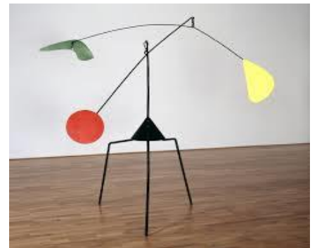
Alexandre CALDER, Untitled 1937