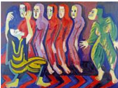
Ernst Ludwig Kirchner, Totentanz der Mary Wigman [Danse macabre de Mary Wigman], 1926-1928 Huile sur toile - 110 x 149 cm

Traduire un mouvement, une posture, une orientation, un équilibre ou une recherche d'équilibre à partir d'un catalogue d'œuvres.