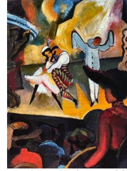
Les Ballets russes, peints par August Macke, 1912