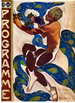
Nijinsky dans l'Après-Midi d'un faune, par Léon Bakst, 1912