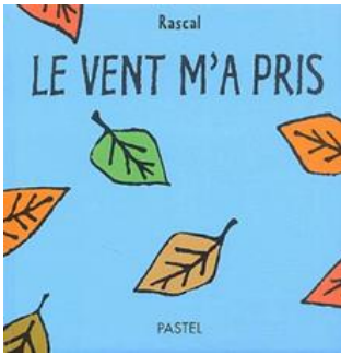
Le vent m'a pris- Rascal