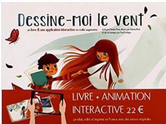
Damien Pons (Auteur), Marina Roel (Illustrations)

Nahel, un petit garçon rêveur, et Leila, un courant d'air, comparent leurs regards sur le monde. Un conte interactif composé d'un album et d'une version animée sur tablette. (à partir de 5 ans)