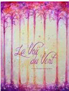
Claire Godard - Ida Polo (illus.) - Bilboquet (nov 2017) coll. Les messagers (à partir de 3 ans)

Un pop-up sur le thème du vent qui ébouriffe le feuillage des arbres, façonne les dunes ou gonfle les voiles des bateaux. (à partir de 4 ans)