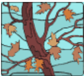
Susumu Shingu - Gallimard-Jeunesse (nov 2017)

Nahel, un petit garçon rêveur, et Leila, un courant d'air, comparent leurs regards sur le monde. Un conte interactif composé d'un album et d'une version animée sur tablette. (à partir de 5 ans)