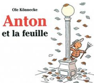
Anton et la feuille Ole Könnecke (Auteur/Illustrateur)