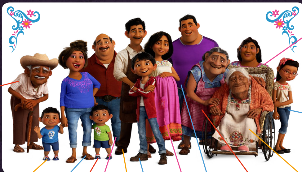
Le grand-père de Miguel, Papá Franco

La ville de Santa Cecilia est inspirée de vrais villages mexicains. Pour le Monde des vivants, les réalisateurs ont opté pour une esthétique ancrée dans la réalité ; l'atmosphère y est poussiéreuse et les couleurs relativement discrètes. Parmi les personnages principaux qui peuplent le monde des vivants figurent plusieurs générations de la famille Rivera, et toutes vivent sous le même toit.